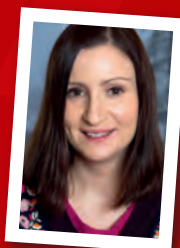
Birgitta Ohlsson EU-minister