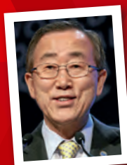
Ban Ki-Moon generalsekreterare FN