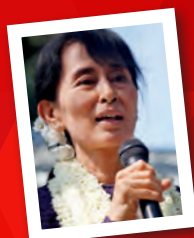
Aung San Suu Kyi burmesisk oppositionsledare