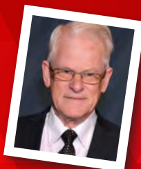
Ingvar Carlsson fd statsminister