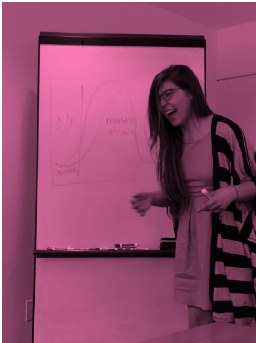
(Leewana berättar om medlemsrekrytering och engagemang)